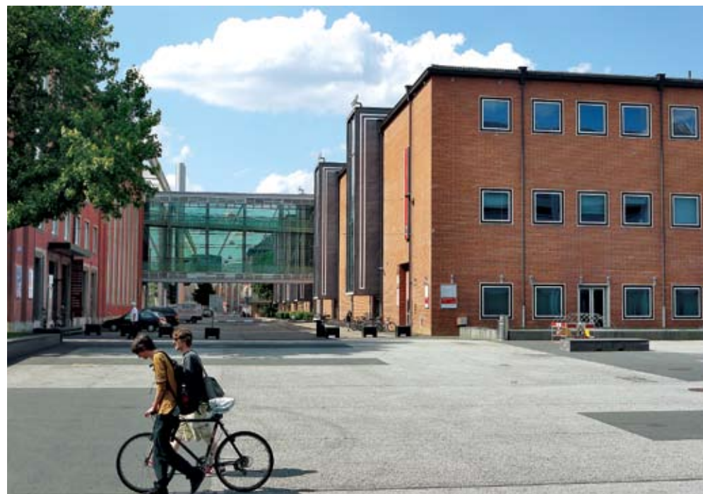
Рис.1 Выставочный павильон №2, построенный в 1954 году по проекту профессора Ханса Хофманна, в 2008 году внесен в перечень исторических зданий.

Система автоматизации здания на базе ПК включает модули ввода/вывода, Ethernet-устройства сопряжения и модульные ПК Beckhoff. Каждая из восьми подстанций имеет модульный