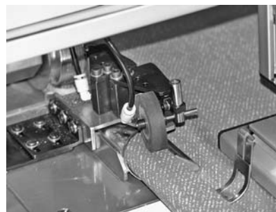
Рис. 2. Армирующая трубка завернута в полотно и плотно прижата посредством ролика