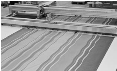
Рис. 3. Полотно перемещается посредством протяжной каретки. Заготовка прижимается механизмом отрезного ножа и протягивается далее вперед

Контактный телефон (495) 981-64-54. Http://www.beckhoff.ru