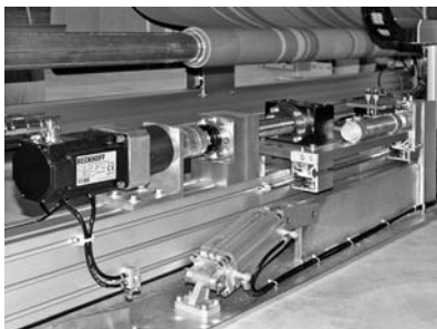
Рис. 4. Сервомотор контроля кромки с системой механической фиксации материи