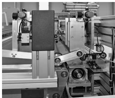
Рис. 1. Упорный ролик (вверху) и ролик-волновод (внизу) без полотна. Направление движения полотна — справа-налево

При помощи плавающего ролика с закрепленным на нем датчиком с прецизионной точностью измеряет-